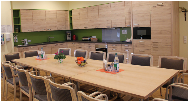
Blick in die Wohnküche der Tagesklinik

Die Tagesklinik in Aachen ermöglicht eine wohnortnahe Versorgung.